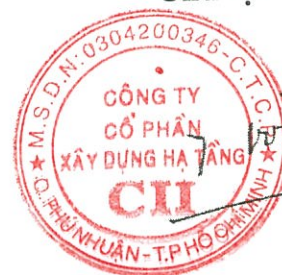
Hồ Đắc Hậu